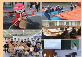
■ 表紙 本号掲載記事より